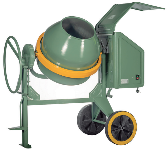
Modelo publicitado: UL160